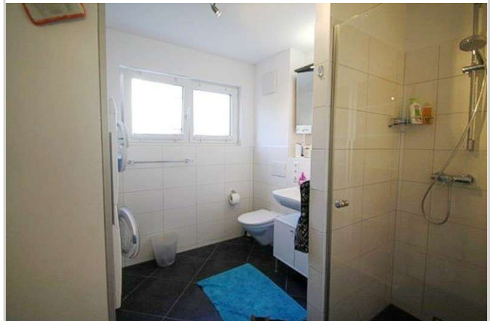
Badezimmer mit Fenster