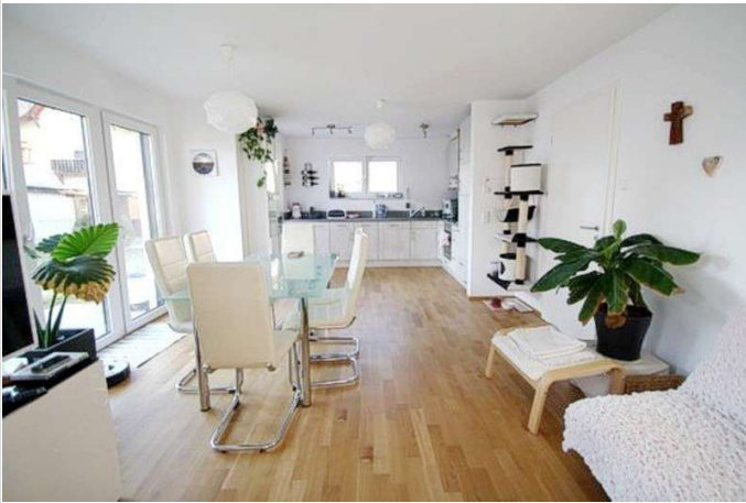
Wohnzimmer m. offener Küche

Zimmer: 2,00 Wohnfläche ca.: 65,00 m 2 Kaltmiete: 1.105,00 EUR (zzgl. Nebenkosten) Gesamtmieta: 1.400,00 EUR