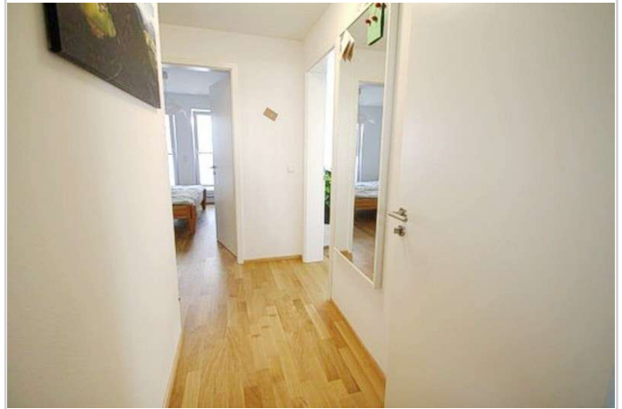
Weitere Ansicht Diele