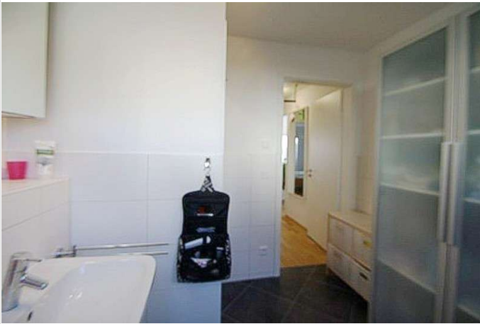
Badezimmer weitere Ansicht

Zimmer: 2,00 Wohnfläche ca.: 65,00 m 2 Kaltmiete: 1.105,00 EUR (zzgl. Nebenkosten) Gesamtmieta: 1.400,00 EUR