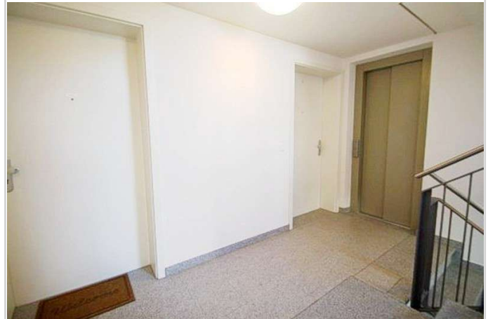
Treppenhaus mit Lift