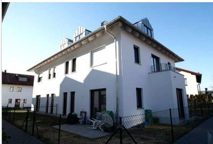
Kleine Moderne Wohnanlage