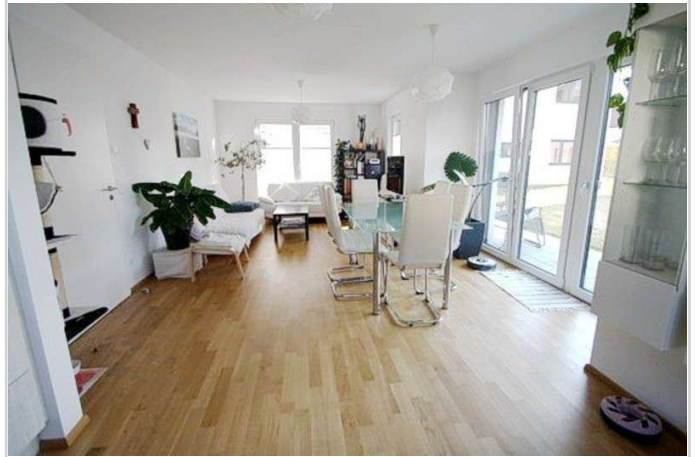
Wohnzimmer weitere Ansicht